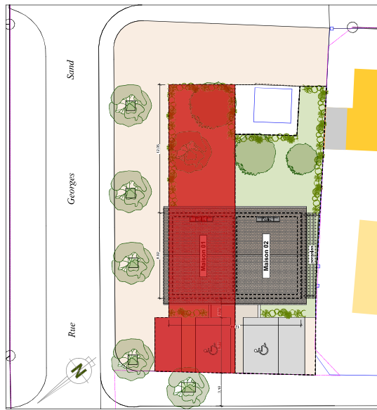
TYPE 3 - MAISON 01