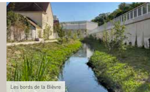
Les bords de la Bièvre