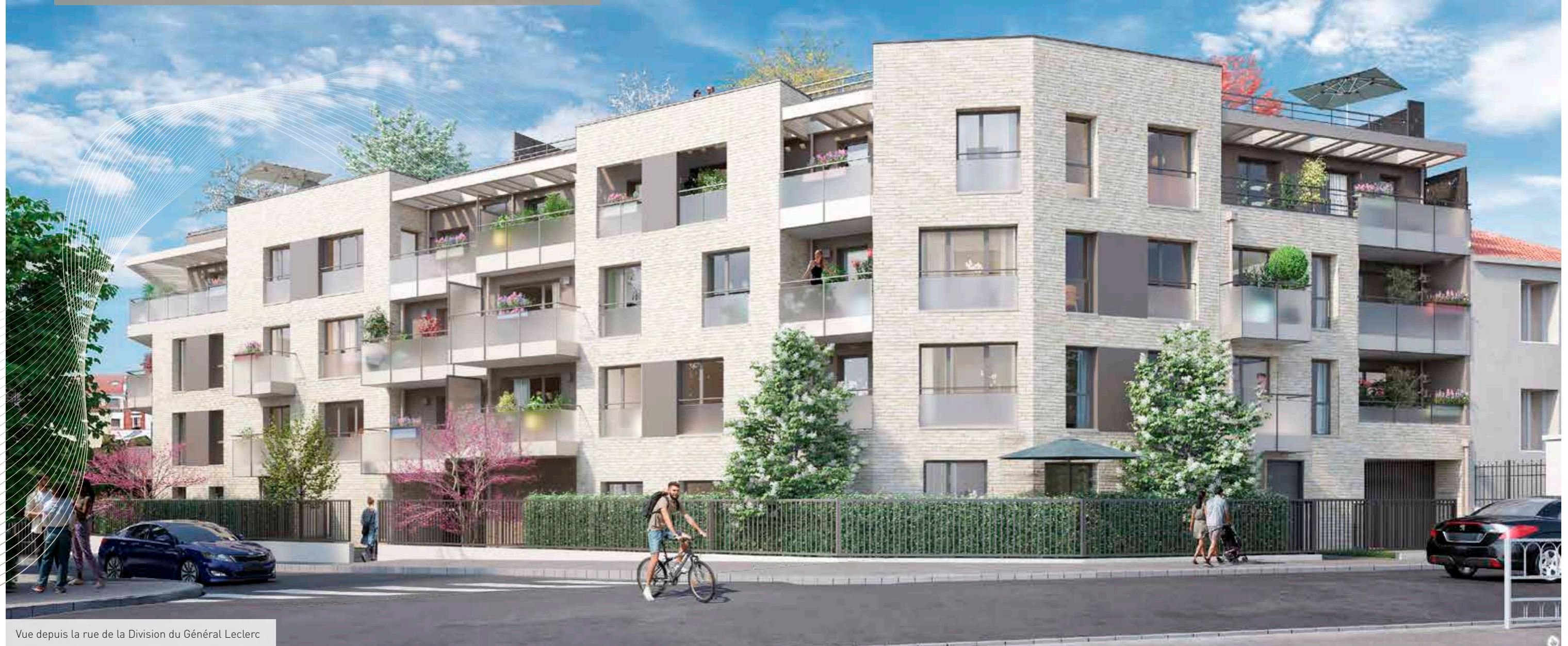
Vue depuis la rue de la Division du Général Leclerc