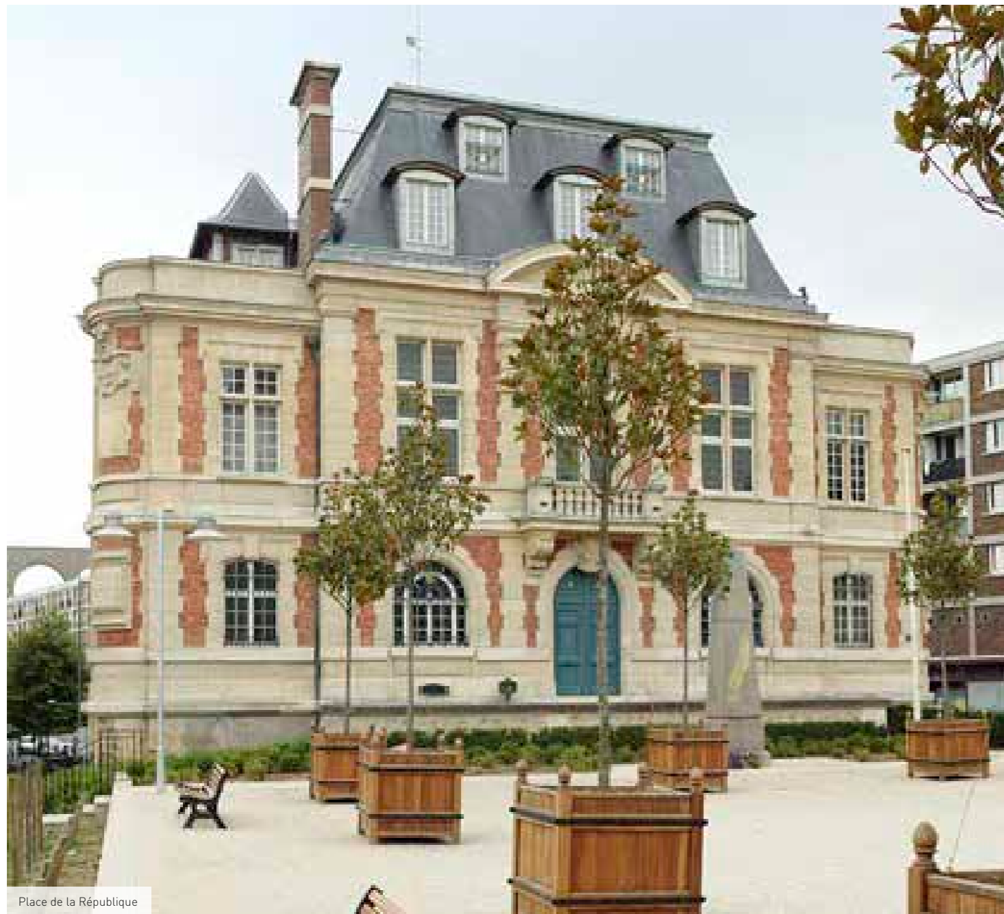
Place de la République