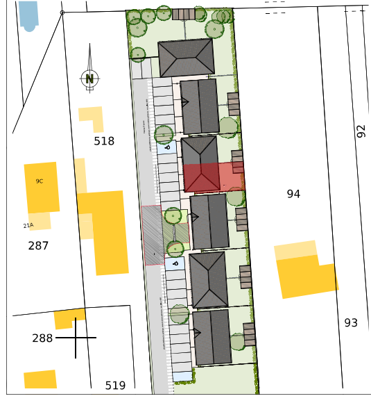
TYPE 3 - MAISON 07