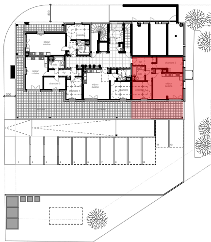
plan de localisation