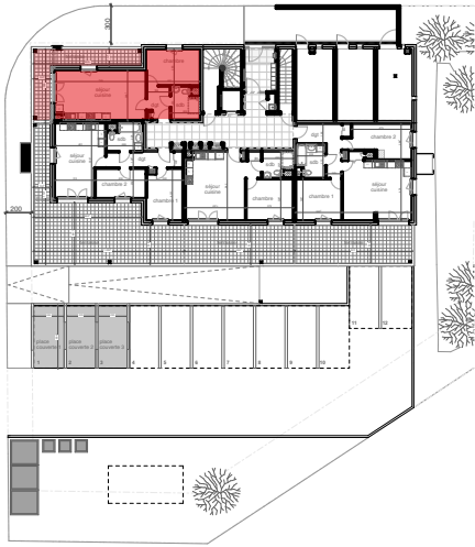
plan de localisation rez-de-chaussée