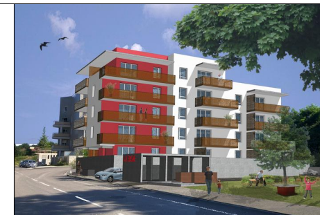
La Cerisaie 18 logements 38 340 Voreppe