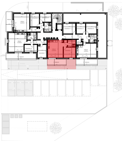
plan de localisation premier étage