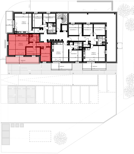
plan de localisation premier étage