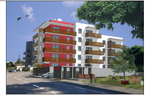
La Cerisaie 18 logements 38 340 Voreppe