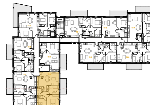
plan du premier étage